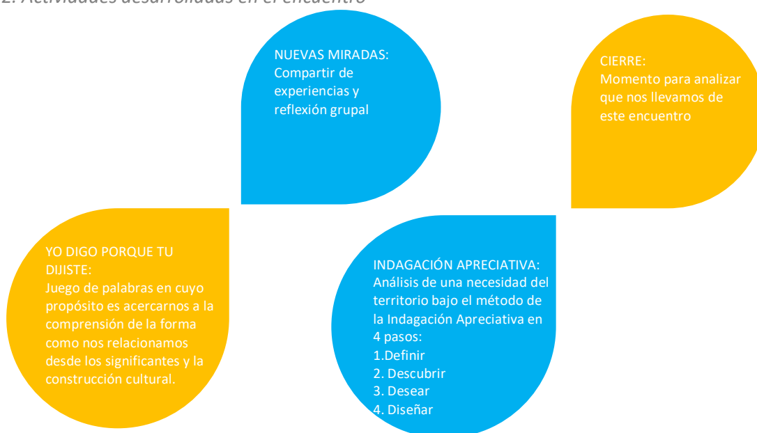
Gráfico 2. Actividades desarrolladas en el encuentro

Durante el encuentro se propusieron varios momentos para acercarse a los propósitos iniciales